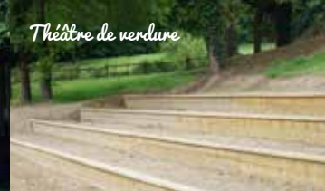
Théâtre de verdure