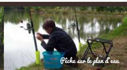
Pêche sur le plan d'eau