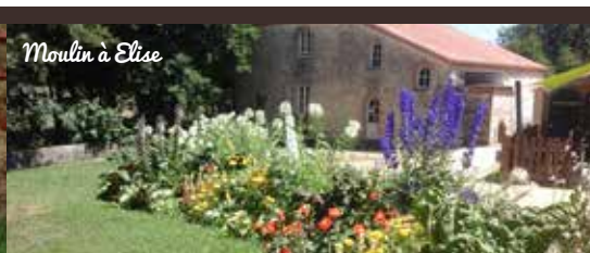
Moulin à Elise