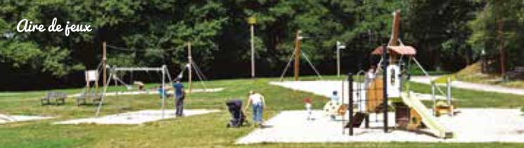
Aire de jeux