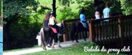
Balade du poney club