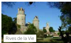
Rives de la Vie